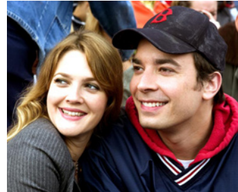
2005 TERRAIN D'ENTENTE (Fever Pitch) de Bobby et Peter Farrelly avec Jimmy Fallon