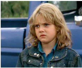
1980 AU-DELÀ DU RÉEL (Altered States) de Ken Russell