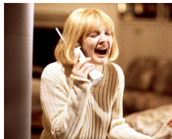
1996 SCREAM / FRISONS (Scream) de Wes Craven