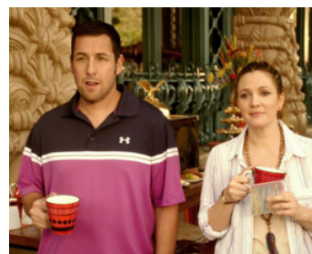
2014 FAMILLE RECOMPOSÉE (Blended) de Frank Coraci avec Adam Sandler