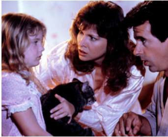
1985 CAT'S EYE (Cat's Eye) de Lewis Teague avec Candy Clark, James Naughton