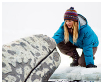
2012 MIRACLE EN ALASKA (Big Miracle) avec Ken Kwapis