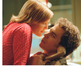
2002 CONFESSIONS OF A DANGEROUS MAN de George Clooney avec Sam Rockwell