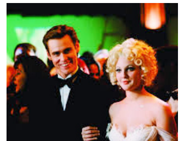
1995 BATMAN FOREVER (Batman Forever) de Joel Schumacher avec Jim Carrey