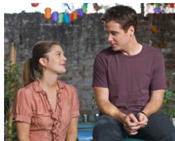
2009 CE QUE PENSENT LES HOMMES (He's just not that into you) de Ken Kwapis avec Kevin Connolly