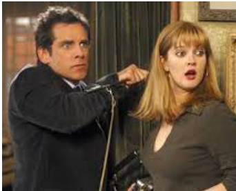
2003 UN DUPLEX POUR TROIS (Duplex) de Danny De Vito avec Ben Stiller