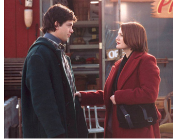
2001 ÉCARTS DE CONDUITE (Riding in Cars with Men) de Penny Marshall avec Steve Zahn