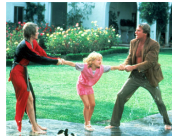
1984 DIVORCE À HOLLYWOOD (irreconcilable Differences) de C. Shyer avec Sh. Long, R. O'Neal