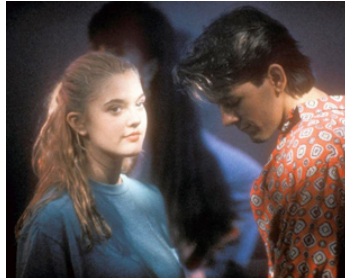
1992 NO PLACE TO HIDE (No Place to Hide) de Richard Danus avec Seth Marten