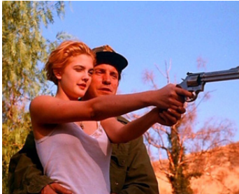
1992 LE DÉMON DES ARMES (Guncrazy) de Tamra Davis avec James Le Gros