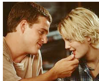
1995 DE L'AMOUR ET LA FOLIE (Mad Love) d'Antonia Bird avec Chris O'Donnell