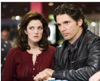
2009 LA CHANCE DANS LA BALANCE (Lucky You) de Curtis Hanson avec Eric Bana