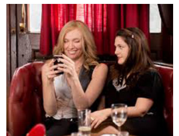
2015 MA MEILLEURE AMIE (Miss you already) de Catherine McCormack avec Toni Collette