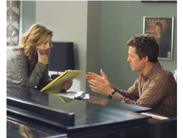
2007 LE COME BACK (Music and Lyrics) de Marc Lawrence avec Hugh Grant