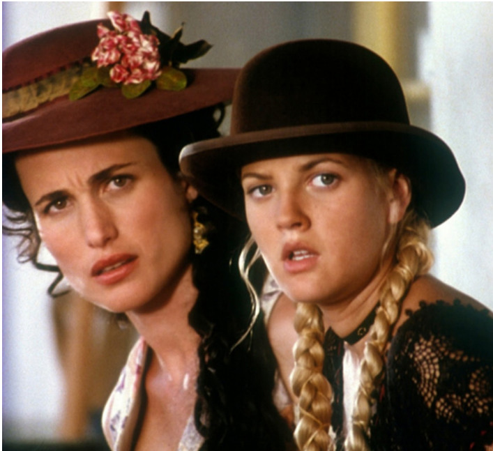
1994 BELLES DE L'OUEST (Bad Girls) de Jonathan Kaplan avec Andie MacDowell