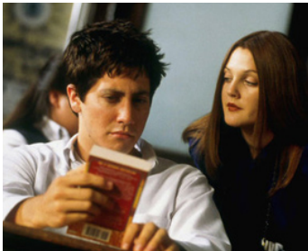
2001 DONNIE DARKO (Donnie Darko) de Richard Kelly avec Jack Gyllenhaal