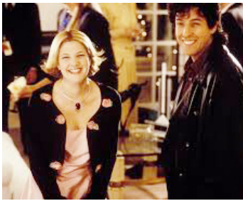
1998 DEMAIN ON SE MARIE ! (The Wedding Singer) de Frank Coraci avec Adam Sandler