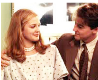
1996 TOUT LE MONDE DIT I LOVE YOU (Everybody says I love you) de W. Allen avec Edward Norton