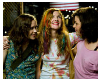
2009 BLISS, ÇA ROULE ! (Whip it) de Drew Barrymore avec Ellen Page, Alia Shawkat