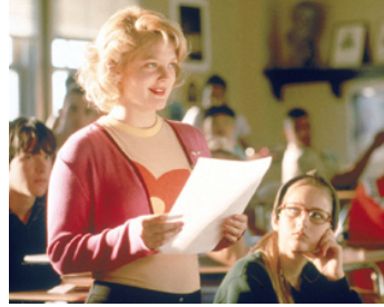
1999 COLLÈGE ATTITUDE (Never been kissed) de Raja Gosnell avec Leelee Sobieski