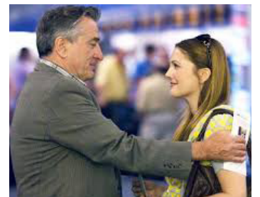
2009 TOUT VA BIEN (Everybody's Fine) de Kirk Jones avec Robert De Niro