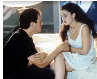
1993 LE DOUBLE MALÉFIQUE (Doppelgänger) d'Avi Nesher avec George Newbern