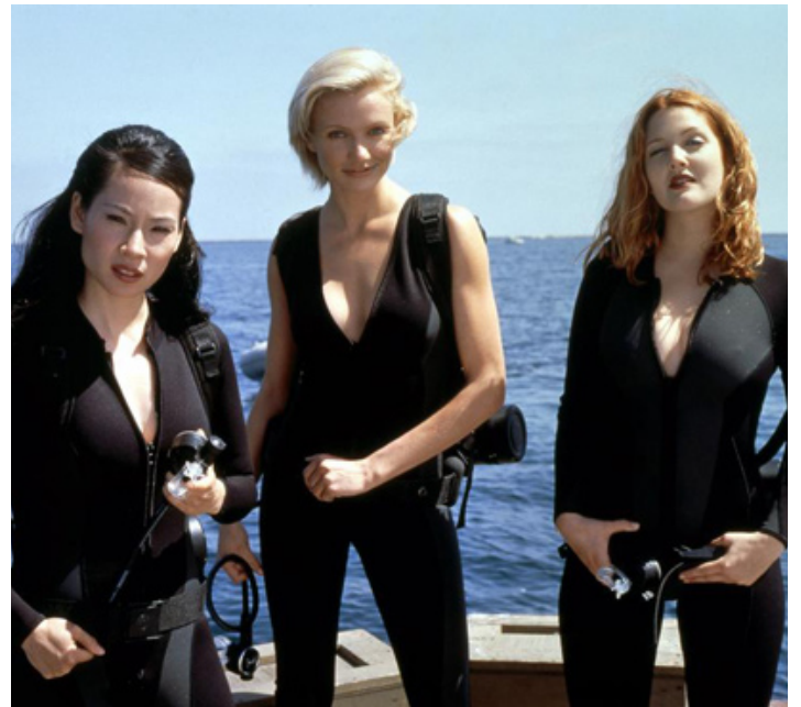
2000 CHARLIE ET SES DRÔLES DE DAMES (Charlie's Angels) de McG avec Lucy Liu, Cameron Diaz