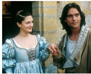
1998 UNE HISTOIRE DE CENDRILLON (Ever After) d'Andy Tennant avec Dougray Scott