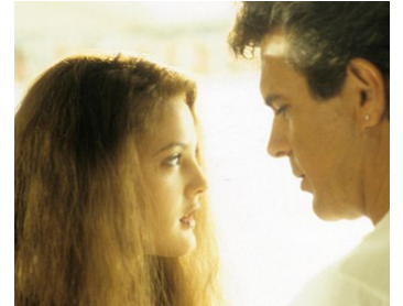
1993 L'HISTOIRE D'AMY FISHER (The Amy Fisher Story) d'Andy Tennant avec J. Denison